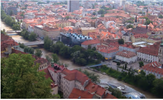
2003년 유럽문화수도인 그라츠 전경