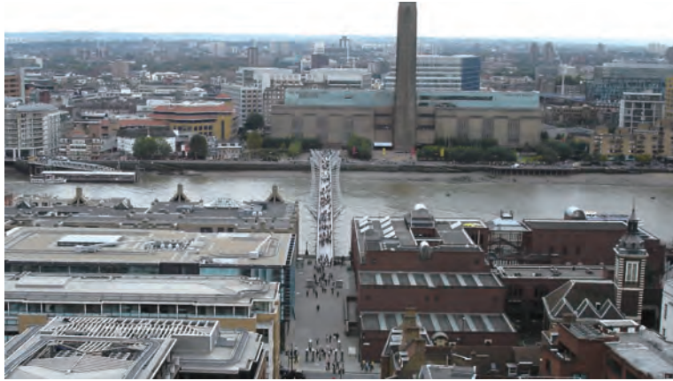
테이트모던과 밀레니엄 브리지를 중심으로 한 템스강 전경

아울러 지방 정부가 소유한 땅을 개발하여 시민들에게 제공함과 동시에 개발이익을 지속적으로 재투자하여 시민들로부터 지지를 이끌어냈다. 결국 빌바오 도시재생의 핵심을 구겐하임 박물관의 등장에 둘 것인지, 메트로폴리스-30 및 리아 2000이 수립한 일련의 정책과 그에 의한 시행에 둘 것인지에 따라 빌바오 효과를 해석하는 방식은 본질적인 차이를 갖는다.