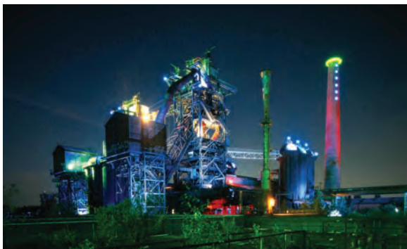
뒤스부르크 환경공원 야경