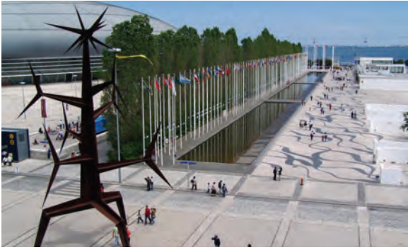
1998년 리스본엑스포를 위해 건설된 공원