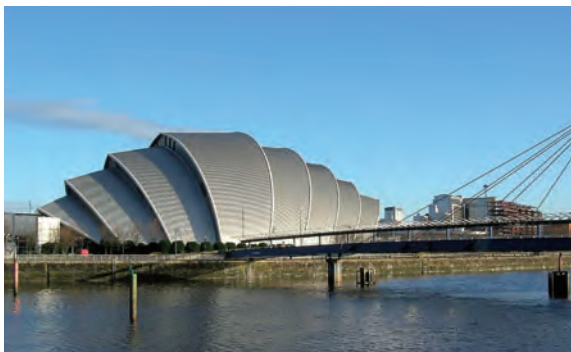
글래스고의 스코틀랜드 전시회의센터

시행 초기에 유럽문화수도제도는 다분히 각종 축제를 중심으로 관광객을 유치하기 위해 문화 행사를 개최하는 성격이 강하였다. 그러나 1990년 스코틀랜드의 글래스고를 기점으로 문화가 쇠퇴한 제조업 도시의 재생을 촉진하는 방식으로 등장함으로써 이전과 다른 국면에 접어들었다.** 글래스고는 1991년에 설립된 ‘글래스고 개발청(Glasgow Development Agency)’이 주도해 쇠퇴한 공업시설이 자리했던 지역을 문화를 중심으로 한 친환경적 공공공간으로 탈바꿈시켜 유럽에서 가장 다양하게 즐길 거리가 많은 지역으로 만들었다. 이 과정에서 노먼 포스터의 ‘스코틀랜드 전시회의 센터’, 자하 하디드의 ‘교통박물관을 비롯해 사이언스몰, 타워, 아이맥스 영화관을 갖춘 ‘글래스고