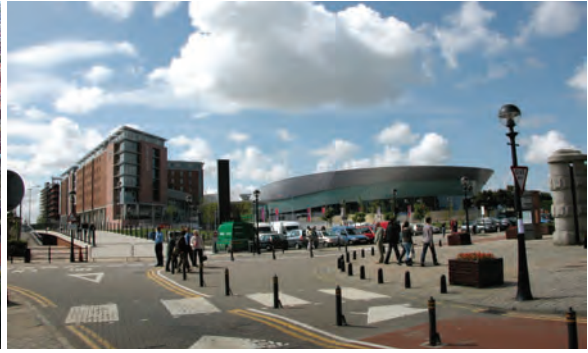
2008년 유럽문화수도인 리버풀 전경