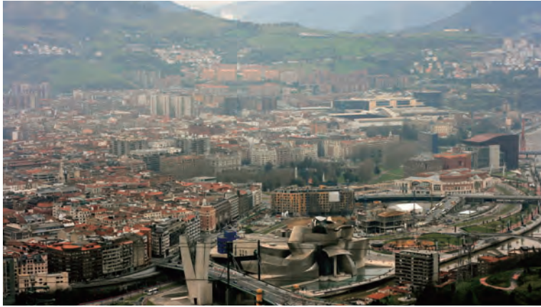
빌바오 구겐하임을 중심으로 한 빌바오 전경

중심에 빌바오 구겐하임이 자리한다. 21세기에 접어들면서 구겐하임 효과를 분석한 연구들이 쏟아져 나왔는데 그중에서 가장 의미 있는 것은 ‘빌바오 구겐하임의 교훈(Learning from the Bilbao Guggenheim)’이라 할 수 있다.* 바스크 지역의 다양한 학자들이 객관적인 분석과 의견을 제시했는데, 핵심은 ‘빌바오 구겐하임 박물관은 빌바오 시가 기획한 전체 도시재생 시나리오의 한 부분으로, 문화와 경제의 새로운 관계를 정립하는 역할을 했다’는 것이다.** 이러한 맥락에서 빌바오 도시재생을 실현하는 데 중추적 역할을 담당한 기관은 ‘빌바오 메트로폴리스-30(Bilbao Metropolis-30)’과 ‘빌바오 리아 2000(Bilbao Ria 2000)’이다.***