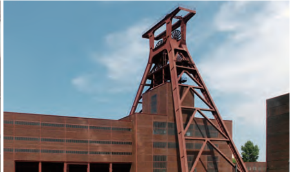
에센 출퍼라인 탄광의 루르 박물관

노먼 포스터가 12번 수직갱도의 안쪽에 자리한 보일러실을 개조하여 '레드닷 디자인 박물관'을 디자인하였고, 램 콜하스는 석탄 세척 공장을 재활용하여 '루르 박물관'을 디자인하였다. 그런가 하면 세지마 가즈요와 니시자와 류에가 '출퍼라인 경영 및 디자인대학'을 디자인하였다. 이러한 일련의 과정을 거치면서 출퍼라인 탄광 일대에는 디자인 관련 기업·학교·재단·공공기관 등이 자리 잡음으로써 경제·사회적 맥락에서 완벽한 재생을 이루었다.