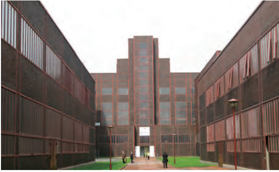
에센 출퍼라인 탄광의 레드닷 디자인 박물관