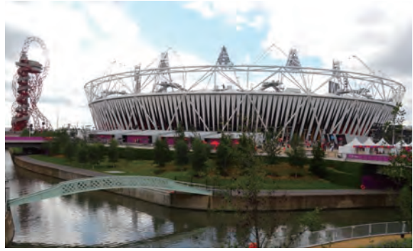
2012년 런던올림픽 주경기장과 주변

통해 정점에 이르렀다. 런던 동쪽의 버려진 공업지역을 올림픽공원 조성을 위한 부지로 선정된 런던시는 '경제적·사회적·환경적' 맥락을 종합적으로 아우르는 지속가능한 도시발전을 올림픽이 추구해야 하는 새로운 역할로 제시하였다.* 이를 위하여 준비 과정에서 보여준 △방치된 공업지대에서 수거한 폐기물의 재활용 △사용 후 해체 가능한 경기장 건립 △이산화탄소 배출량 최소화 △올림픽이 끝난 후에 사회기반시설 및 주거 공급 △올림픽 부지의 공영화 계획 △올림픽에서 사용되었던 거의 모든 시설의 재활용 등은 그동안 일회성 올림픽이 낳은 지속불가능성에 대한 비판을 불식시키는 데 크게 기여하였다. 이와 같은 접근은 지난 세기와 달리 오늘날 벌어지는 대규모 이벤트가 지속가능한 도시재생의 첨병이 될 수 있음을 입증하였다는 점에서 큰 의미를 부여할 수 있다.