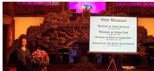
장윤규 대표(운생동) 발제