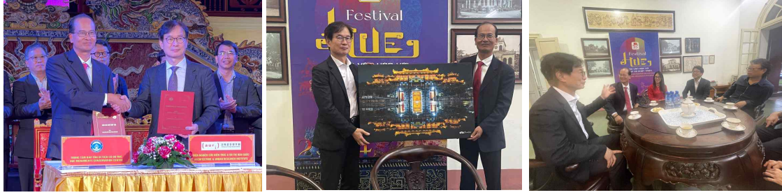
AURI-HMCC 세레머니 및 간담회