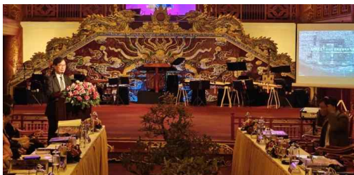
이영범 원장(건축공간연구원) 발제