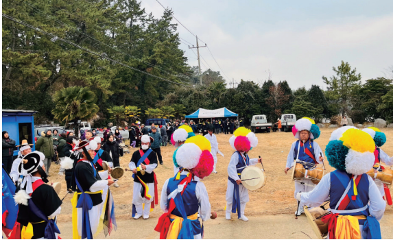
고흥군 앵커조직 활동 모습