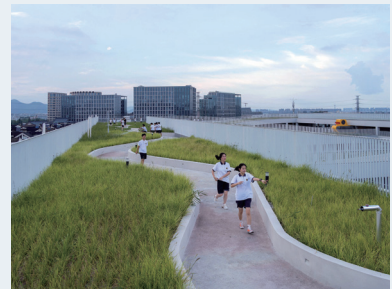
후이전 고등학교 ©Approach Design Studio - Zhejiang University of Technology Engineering Design Group Co.,Ltd

출처: 세계건축축제 보도자료. https://www.v2com-newswire.com/en/newsroom/categories/commercial-architecture/press-kits/661-80/world-building-of-the-year-and-interior-of-the-year-revealed-at-2023-world-architecture-festival (검색일: 2023.12.15.)