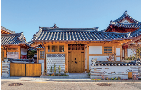
중공한옥 부문 올해의 한옥대상 : 정다운 집