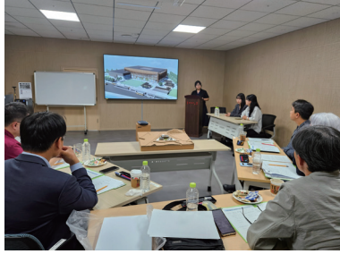
학생공모전 부문 발표심사(2차)