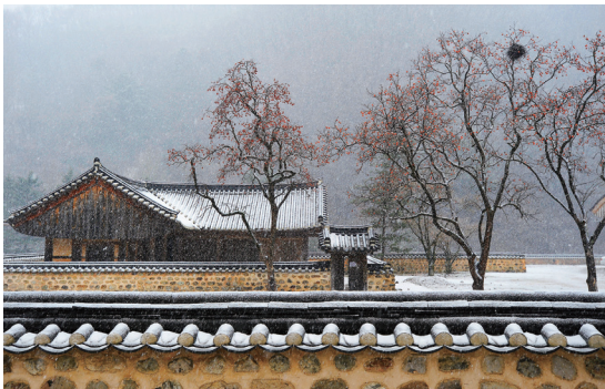
사진 부문 대상 : 설일