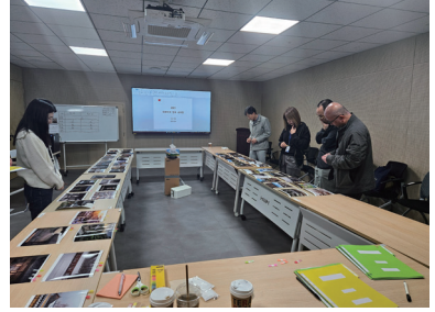
사진 부문 종합심사(2차)