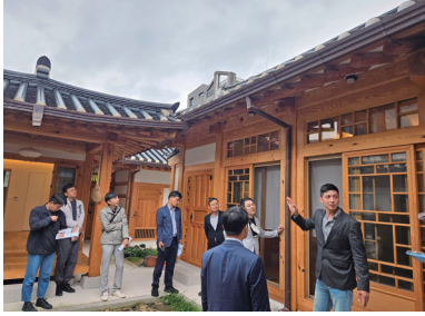
준공한옥 부문 현장심사(2차)