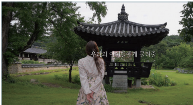
영상 부문 대상 : 또 다른 한류, 한옥