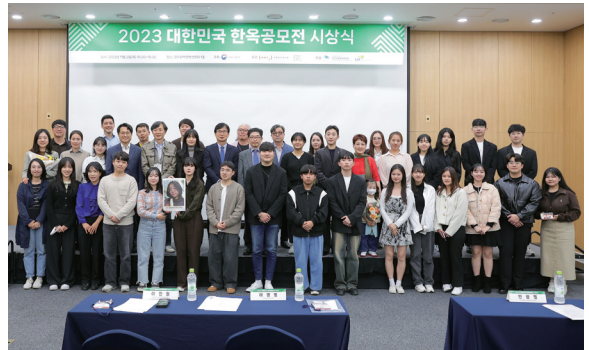
2023 대한민국 한옥공모전 시상식