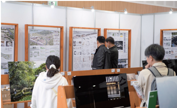
2023 대한민국 한옥공모전 전시회

이상 준공한옥 3개, 학생공모전 13개, 사진 29개, 영상 8개 수상작품은 대한민국 한옥공모전 홈페이지