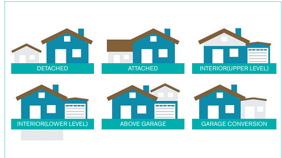
배치 형태에 따른 ADU 유형

2018년도 AARP 설문조사에 의하면 18세 이상 성인의 67%가 ADU는 '소중한 사람과 가깝게 지낼 수 있는 방법임과 동시에 독립적인 생활공간을 지킬 수 있는 대안'이라고 응답하였으며, 65세 이상 노인인구의 약 3분의 2가 일상 활동을 도울 수 있는 '간병인을 위한 공간으로 ADU를 건축할 계획이 있다'고 답하였다. 해당 설문조사의 2021년 ADU 관련 질문에서는 ADU를 '돌봄이 필요한 가족(86%)' 또는 '친척이나 친구(86%)'를 위한 장소, '간병인이 머무를 수 있는 장소(67%)'나 '세입자에게 임대하여 추가 수입(63%)을 얻을 용도'로 사용할 것이라고 응답하였다.