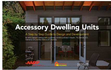
AARP의 ADU 개발 및 디자인 가이드

ADU는 기존 주택과의 거리 및 배치에 따라 다양한 유형으로 나누어진다(AARP et al., 2019a). 분리형(Detached) ADU는 ADU 건물이 기존 주택에서 물리적으로 완전히 분리된 형태로, 거주 가구들의 독립성 및 프라이버시를 유지하는 데 가장 적합한 형태이다. 특히 기존 주택과 분리된 형태로 건축되기 때문에 기존 주택 또는 차고의 품질이나 조건에 관계없이 지