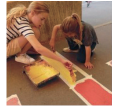
오아시스 프로그램 설치를 위한 시민참여 안내

와 교육을 동시에 충족시킨다. 나아가 도시에 상쾌함을 더할 수 있도록 그늘막과 나무를 추가한다.