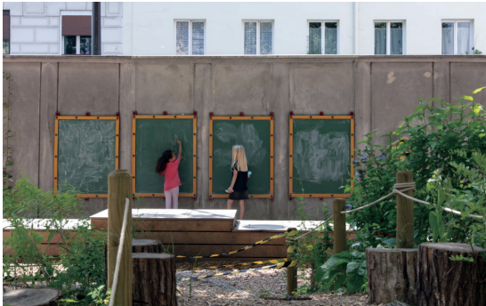
오아시스 프로그램으로 만들어진 학교 안뜰 - 켈러초등학교(Cour Oasis de l'école élémentaire Keller)

에 대한 분석을 통해 오아시스 프로그램이 이루어지는 학교 주변의 사회적 연결에 프로젝트가 얼마나 기여하였는지 평가할 수 있다. 마지막으로 프로젝트의 사회적 이슈에 대한 평가를 설명하는 영상을 통해 효과성과 결과가 공개된다.