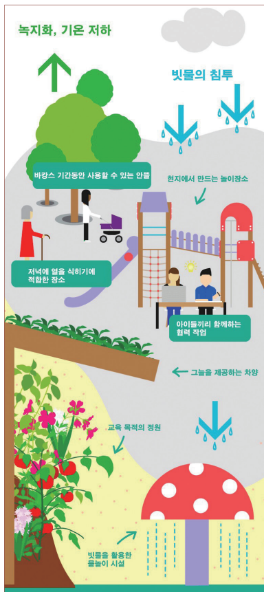
오아시스 프로그램 공간 개념도