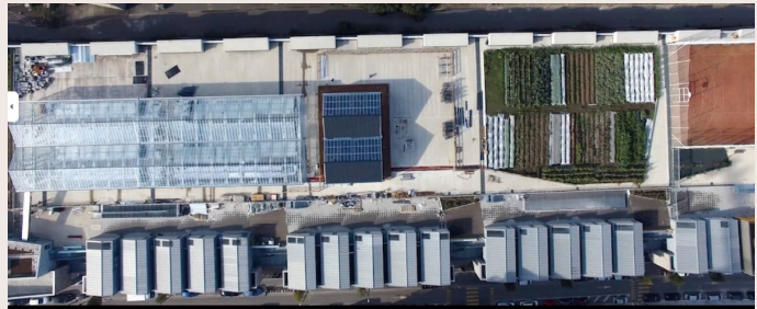
Plantation Paris 옥상 전경

옥상 공간은 채소밭, 온실, 이벤트 공간으로 구성되어 있다. 이벤트 공간은 몽마르트르가 보이는 1000m 2 의 유리 구조물로 되어 있으며 수백 명을 수용할 수 있다. 파리의 다른 옥상텃밭과는 다른 한 가지는 다양한 상업적 이벤트가 있다는 것이다. 특히 이벤트 공간에서는 옥상에서 직접 재배한 식물을 활용한 요리 수업, 옥상 텃밭과 함께하는 요가 수업 등이 상시 진행되고 있으며 지역 주민과 직원들을 위한 요리 워크숍이 열리고 있다.