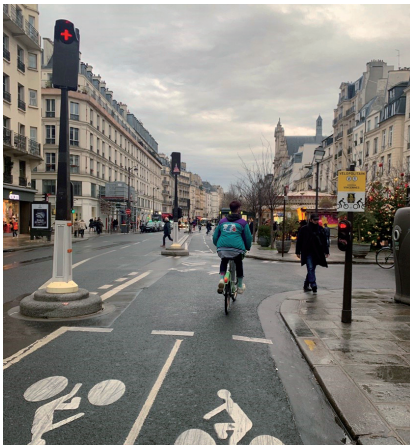
자전거 이용자를 위해 신설된 신호등과 표지판

넓어진 도로 폭과 시선 유도봉을 설치하여 확실하게 자전거 이용자의 안전을 확보하였다.