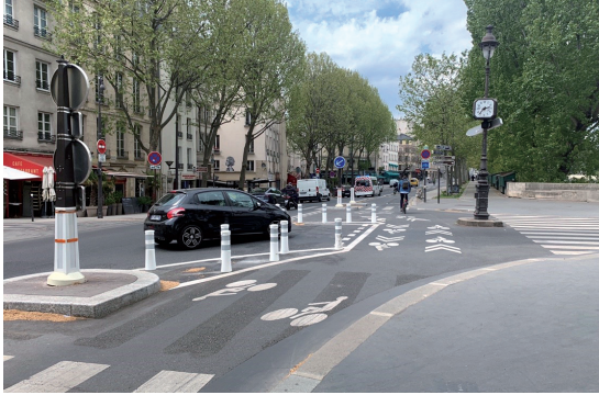
개선된 자전거 도로의 모습

넓어진 도로 폭과 시선 유도봉을 설치하여 확실하게 자전거 이용자의 안전을 확보하였다.