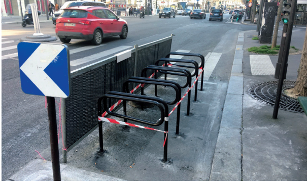
파리시에 설치 중인 야외 자전거 주차대