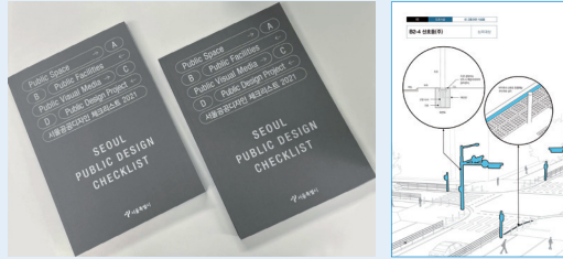
공공디자인 일러스트 가이드라인 책자

한편 공공디자인 일러스트 가이드라인은 관계기관 및 자치구 등에 책자로 배포될 예정이며, 서울시 홈페이지 내 전자책에서 무료로 다운로드 받을 수 있다.