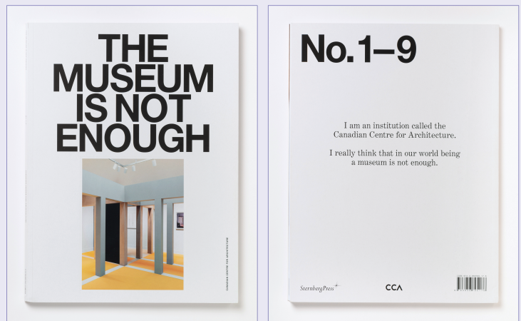
캐나다건축센터의 연간지 <The Museum is not Enough>: 제호가 기관의 비전과 지향점을 잘 보여준다.

이처럼 캐나다건축센터는 ‘-의 건축’을 넘어 ‘-를 위한 건축’과 같은 주제에 주목하며, ‘건축 실천’에 앞장서고 있다.