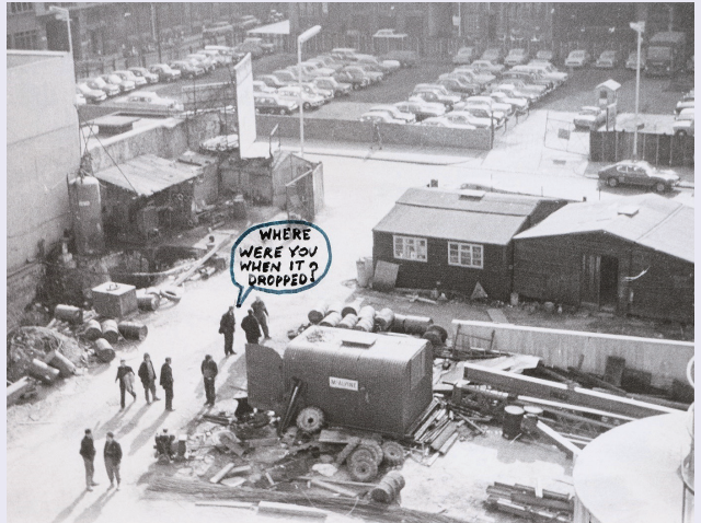
'Cedric Price, McAppy'에 전시된 'Where were you when it dropped?'