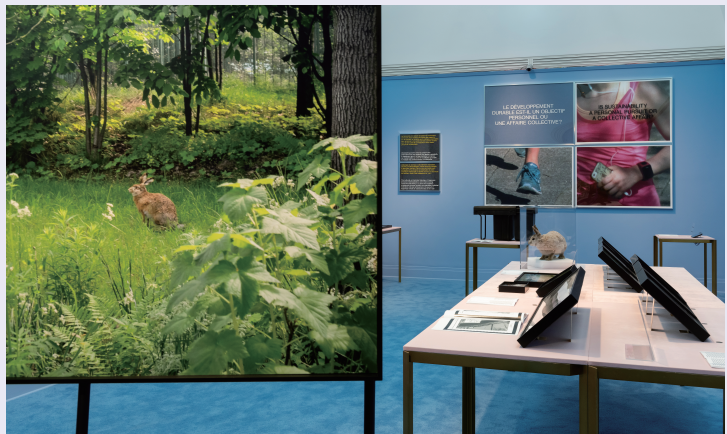
‘우리들의 행복한 삶: 감성 자본주의 시대의 건축과 웰빙(Our Happy Life)’ 전시