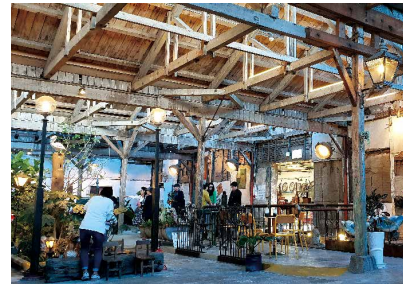
기존 공장건물의 구조와 재료를 그대로 살려 카페와 생활박물관으로 리모델링한 강화도의 조양방직 카페