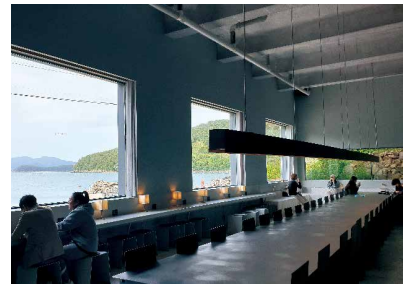
멍게 배양장을 리모델링하여 카페와 문화공간으로 조성한 통영의 배양장 카페