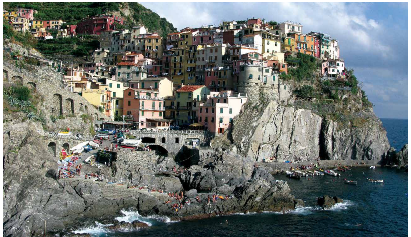
게스트하우스가 모여 있는 중세 골목에서 일상생활을 보내고 있는 친퀘테레의 골목길(좌), 포도경작지로 둘러싸인 친퀘테레(우)