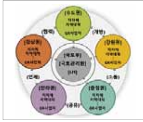
그린리모델링 지역거점 플랫폼