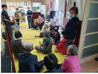
에너지베스트아파트 관련 주민설명회(2020)