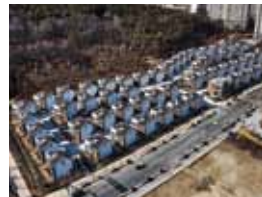
로텐하우스 (단독주택 최초 ZEB 본인증)