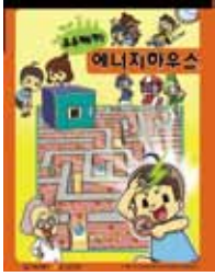
녹색건축 교육 만화(2020)