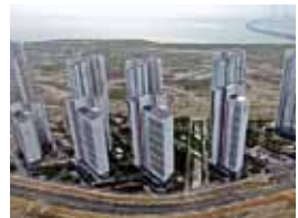
힐스테이트 레이크 송도 (공동주택 최초 ZEB 본인증)