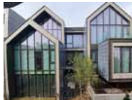
LG ThinQ Home (ZEB 본인증 최초 1등급)

공공 부문의 경우 그린리모델링을 촉진하기 위한 에너지 성능개선 관련 기술 컨설팅 등의 지원 사업과 함께 매년 3만 5,000여 동의 공공건